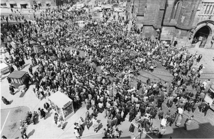
Abb. 2: Sitzstreik von Studierenden sowie Schülerinnen und Schülern vor der Nürnberger Lorenzkirche, 15. Mai 1968 (Nürnberger Nachrichten / Foto: Friedl Ulrich).