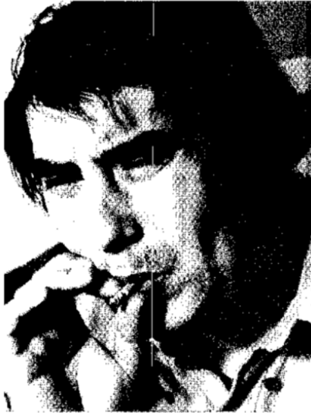
Romanautor Brinkmann „Aufnehmen, was sich bewegt“

Dichter der „Aggressionslust und Kompromißlosigkeit“, 27 der die Öffentlichkeit und ihre Reaktionen brauchte. Brinkmann war ein Dichter, für den weniger die guten Kritiken in den Feuilletons zählten als ein handfester Skandal bei einer Lesung oder sein Foto als „Gesinnungsunrasierter“ im Spiegel . 28