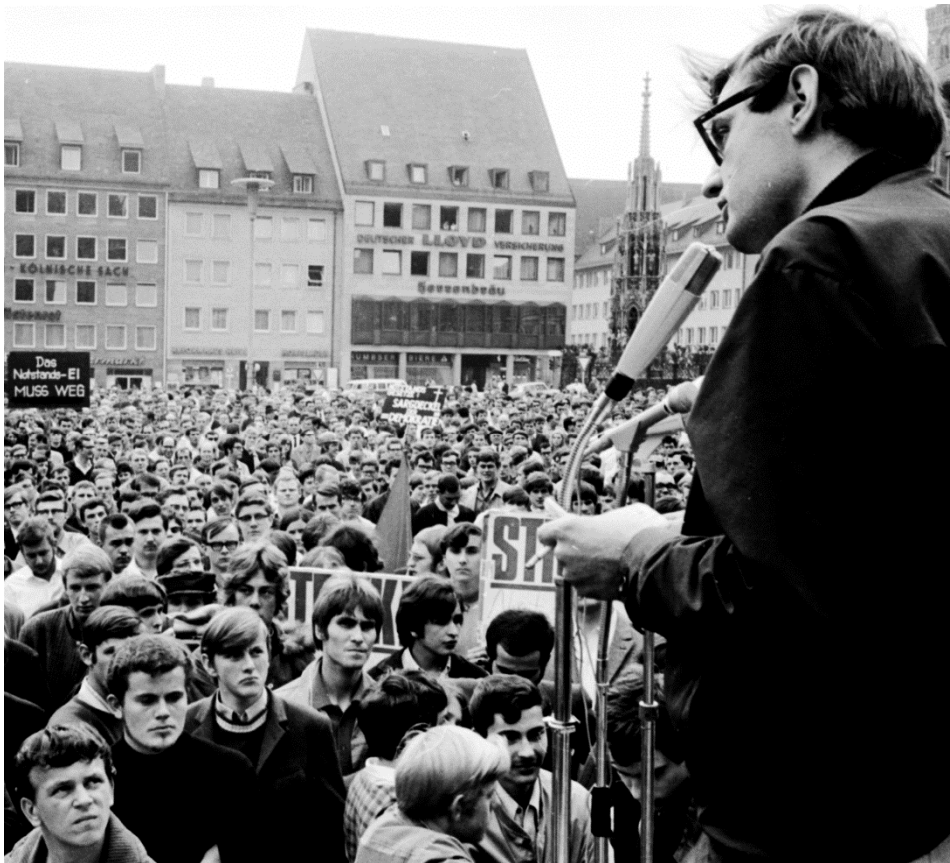
Abb. 8: Elmar Altvater als Redner bei der Kundgebung auf dem Hauptmarkt in Nürnberg, 29. Mai 1968 (Stadtarchiv Nürnberg A50-AS769-F1-07, Foto: Armin Schmidt).