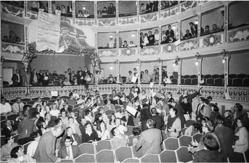
Abb. 6: Protestaktion während einer Aufführung im Rahmen der Internationalen Theaterwoche der Studentenbühnen im Erlanger Markgrafentheater, 29. Juli 1968 (Stadtarchiv Erlangen VIII.3192.N.1/1, Foto: Stümpel).