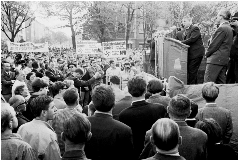
Abb. 3: Kundgebung gegen den NPD-Bundesparteitag vor der Messehalle in Nürnberg; am improvisierten Rednerpult Oberbürgermeister Andreas Urschlechter, 10. Mai 1967.