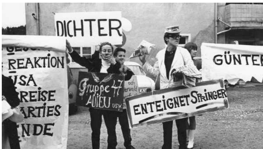
Abb. 2: „Dein Ja zum fröhlichen Gruppenbegräbnis“: Erlanger Studierende protestieren gegen die „Richter-Dichter“ vor der Pulvermühle. 14

Hans Werner Richter, der Organisator des Treffens, beschreibt in seinem Tagebuch den Auftritt zweier Studenten aus Erlangen im erlauchten Kreis der Gruppe: