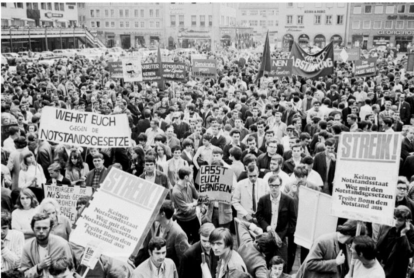
Abb. 7: Kundgebung auf dem Hauptmarkt in Nürnberg gegen die Verabschiedung der Notstandsgesetze, 29. Mai 1968 (Stadtarchiv Nürnberg A50-AS769-F1-17, Foto: Armin Schmidt).