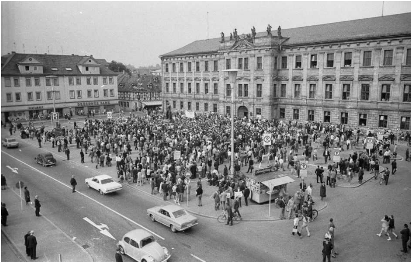
Abb. 9: Protestaktion gegen die Verabschiedung der Notstandsgesetze auf dem Schlossplatz in Erlangen, 29. Mai 1968 (Stadtarchiv Erlangen VIII.11234.N.3/1, Foto: Stümpel).