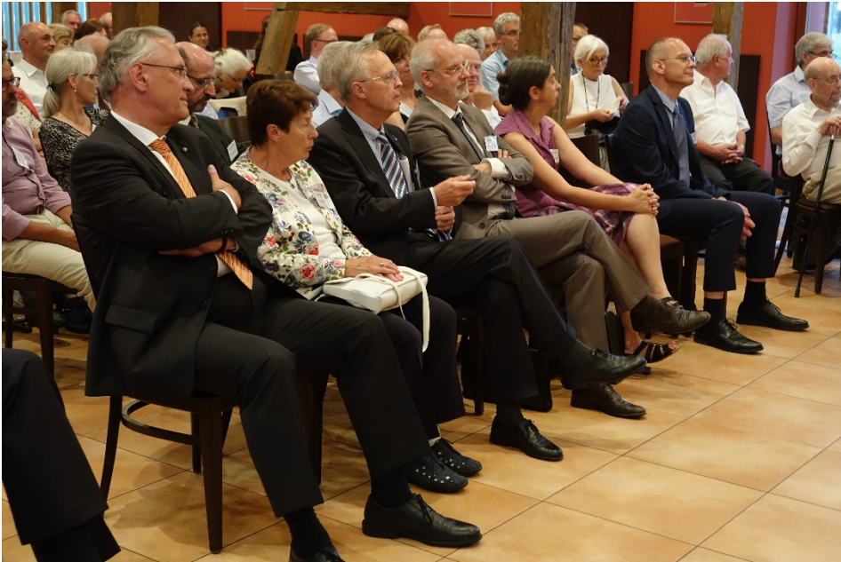
37. „Atzelsberger Gespräche“ 2018