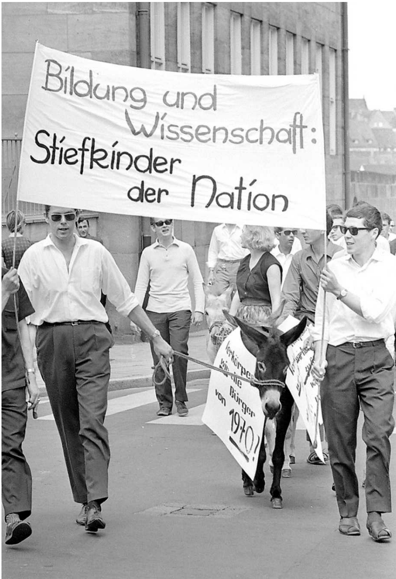
Abb. 1: Protestzug von Studierenden bei der „Aktion 1. Juli“ in der Nürnberger Peter-Vischer-Straße, mitgeführt wurden Esel mit der Aufschrift „Verkörpern wir die Bürger von 1970 ?“, 1. Juli 1965 (Nürnberger Nachrichten / Foto: Friedl Ulrich).