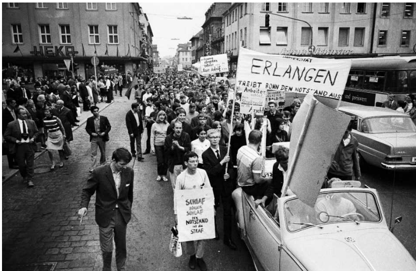
Abb. 10: Demonstrationzug von Studierenden gegen die Verabschiedung der Notstandsgesetze auf der Hauptstraße in Erlangen, 29. Mai 1968 (Stadtarchiv Erlangen VIII.11237.N.2/2, Foto: Stümpel).