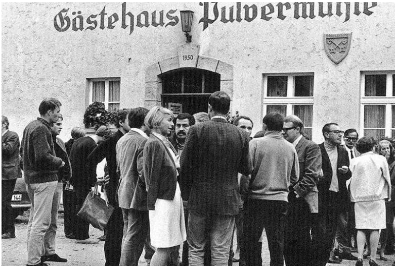
Abb. 1: Treffen der Gruppe 47 in der Pulvermühle bei Waischenfeld (Foto: Toni Richter: Die Gruppe 47, Köln 1997).

Das Bild unten zeigt die Gruppe vor dem Gästehaus der Pulvermühle; im Türrahmen erkennt man Günter Grass: