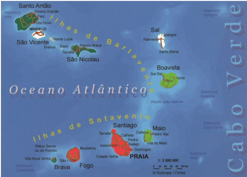
Três ciclos de povoamento do arquipélago © Reitmaier/Fortes, adaptado por Beate Gresser

africana, as ilhas de Santiago e do Fogo cessaram de funcionar como escala obrigatória para os escravos provindos do noroeste africano. A falta de meios financeiros que resultou desta alteração no arquipélago fez com que já não houvesse meios para paliar as consequências desastrosas das recorrentes secas. Os moradores, simultaneamente armadores, comerciantes, e latifundiários, aforraram boa parte dos seus escravos para liberar-se da obrigação de os alimentar. Junto com os escravos fugidos, os aforrados procuraram novas bases de sustento naquelas ilhas, ainda sem povoar, que permitiam uma agricultura de subsistência (ilhas verdes do mapa). Neste segundo ciclo, povoaram-se